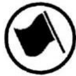
Regularity test start