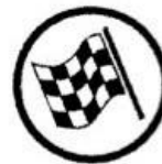
End of regularity test